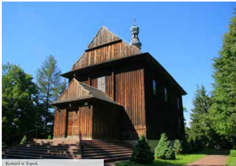
Kościół w Topoli