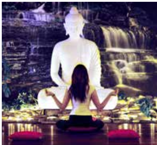
Hotel Odyssey***** w Dąbrowie pod Kielcami