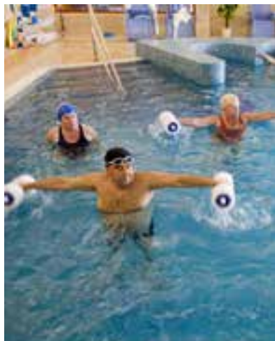
Hotel Malinowy Zdrój w Solcu-Zdroju