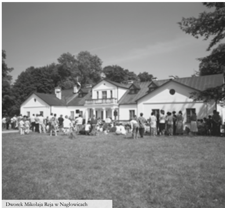
Dworek Mikołaja Reja w Nagłowicach