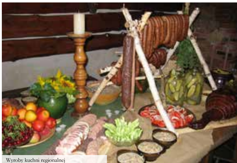
Wyroby kuchni regionalnej