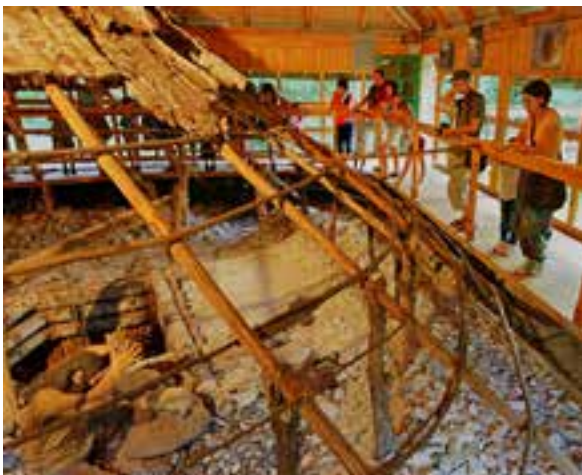
Muzeum Archeologiczne i Rezerwat Krzemionki