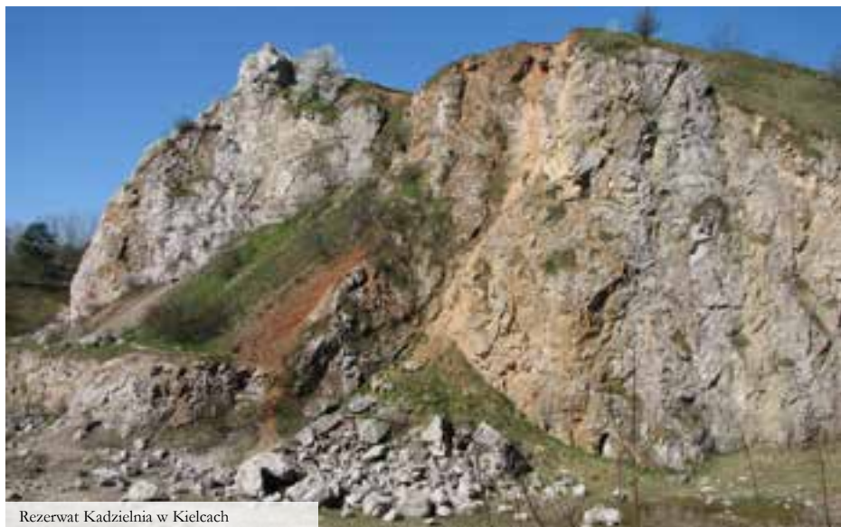
Rezerwat Kadzielnia w Kielcach