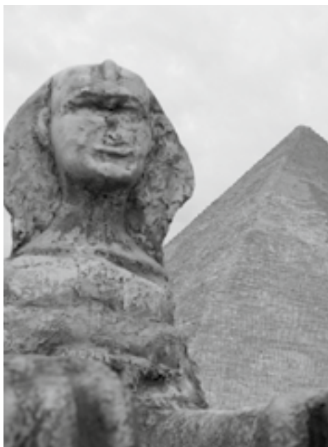
Park Rozrywki i Miniatur Sabat Krajno

Aleja miniatur „Cudowny Świat” ( Wonderful World ), gdzie znajdują się miniatury największych atrakcji turystycznych z całego świata: Plac Św. Piotra z Bazyliką z Watykanu, Koloseum, wenecki most Rialto, fontanna di Trevi, opera w Sydney, wodospad Niagara, a nawet dymiąca Etna. Na szczycie, obok piramid i Etny, znajduje się taras widokowy i przepiękny widok na cały Park Miniatur i Rozrywki Sabat.