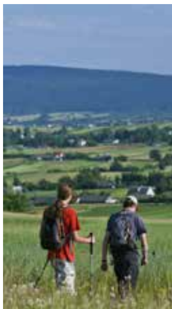
Świętokrzyskie krok po kroku