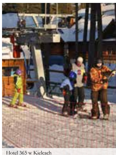
Hotel 365 w Kielcach