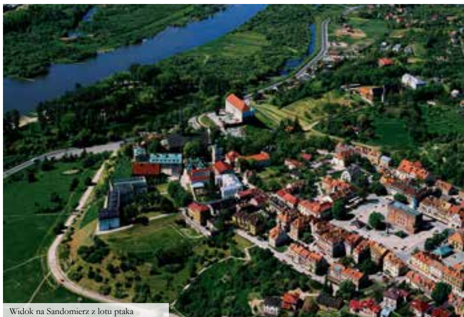
Widok na Sandomierz z lotu ptaka