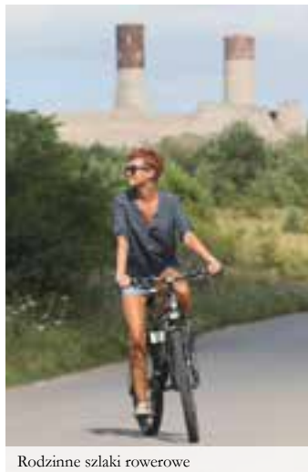
Rodzinne szlaki rowerowe