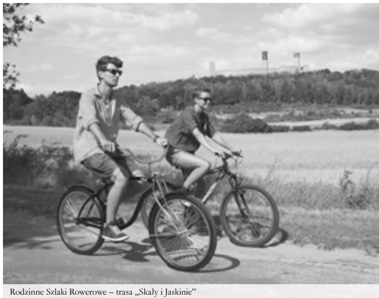
Rodzinne Szlaki Rowerowe – trasa „Skaly i Jaskinie”