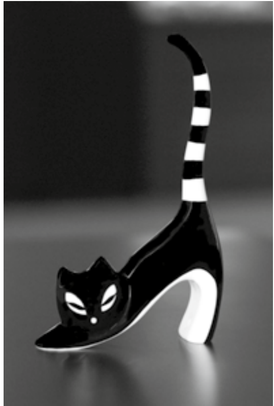
Żywe Muzeum Porcelany w Ćmielowie