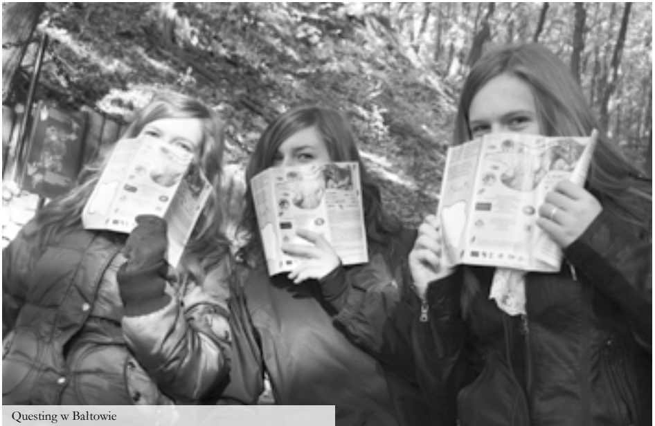
Questing w Bałtowie