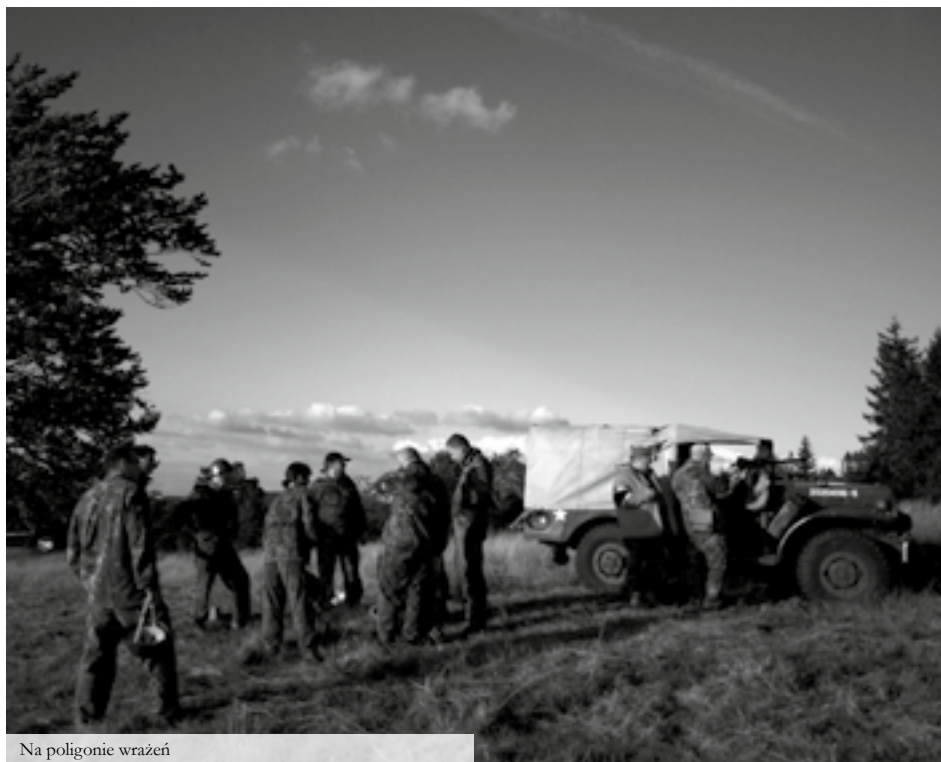
Na poligonie wrażeń

Oferta przeznaczona dla: grup zorganizowanych: pracowników firm, uczestników spotkań integracyjnych, motywacyjnych i treambuildingowych . Oferta może być realizowana przez grupy młodzieży szkolnej i studentów.