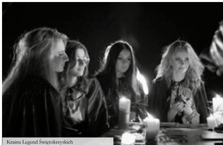
Kraina Legend Świętokrzyskich