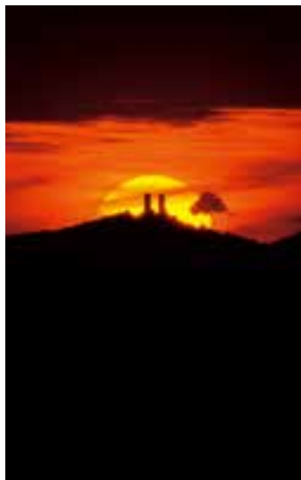
Zachód słońca nad Chęcunami