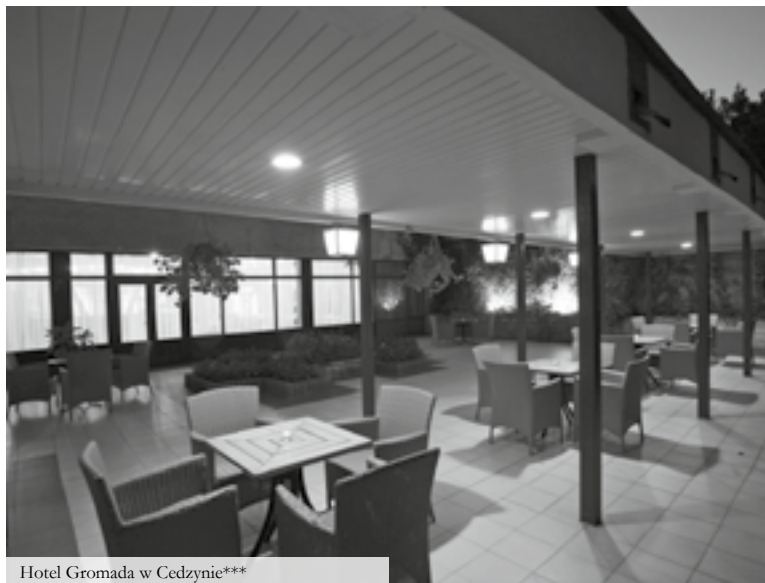
Hotel Gromada w Cedzynie***

Do dyspozycji gości: cztery sale konferencyjne, restauracja, wiata grillowa, kawiarnia, patio, Bar Leśny, sauna, siłownia, room service , pralnia, parking, Internet Hotspot Orange.