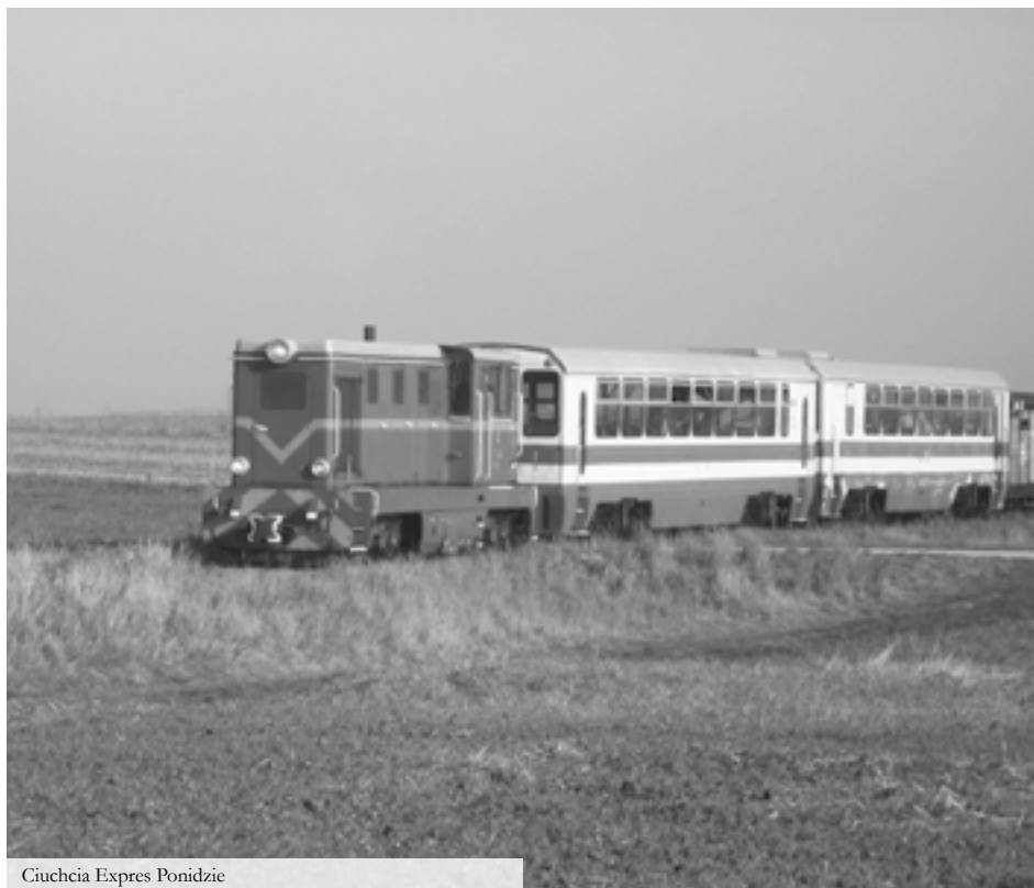
Ciuchcia Expres Ponidzie