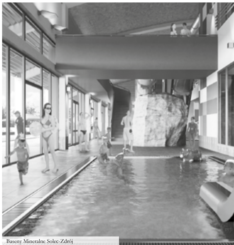
Baseny Mineralne Solec-Zdrój