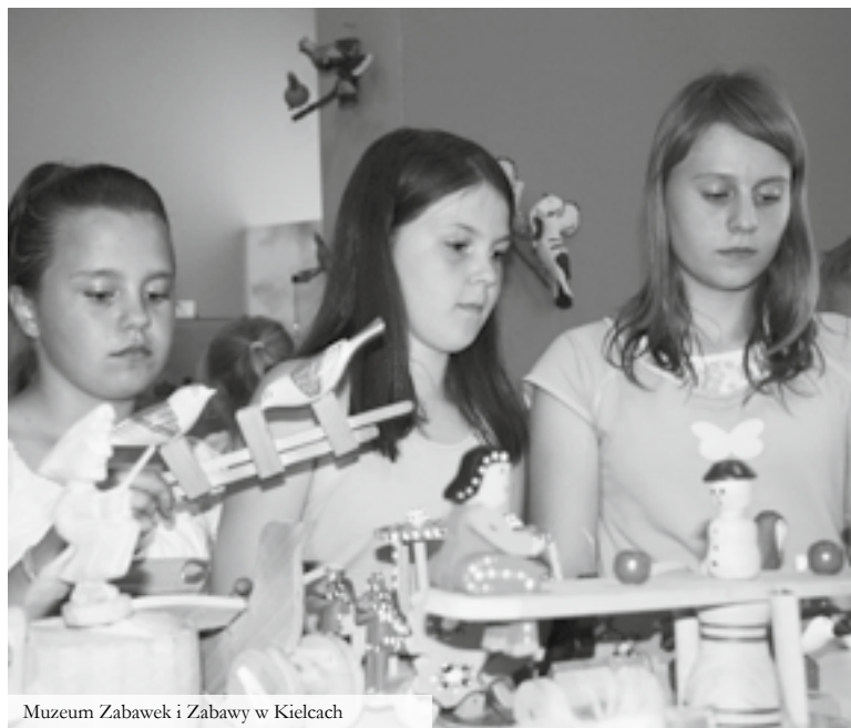
Muzeum Zabawek i Zabawy w Kielcach

Oferta przeznaczona dla: zorganizowanych grup młodzieży szkolnej (szkoła podstawowa i gimnazjum). Elementy programu mogą być realizowane również przez osoby indywidualne.