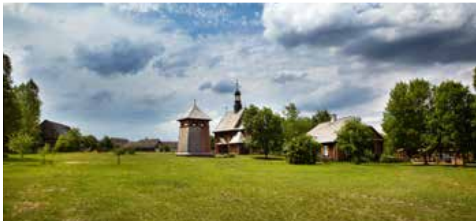
Muzeum Wsi Kieleckiej – Park Etnograficzny w Tokarni