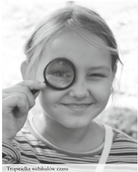
Tropicielka wehikulów czasu

Dom i Biblioteka Sichowska im. Krzysztofa i Zofii Radziwiłłów Sichów Duży 88, 28-236 Rytwiiany tel. 15 864 16 28 www.sichow.eu, sochow@sichow.eu