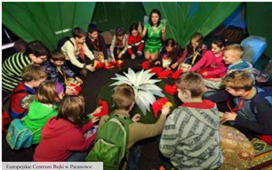
Europejskie Centrum Bajki w Pacanowie