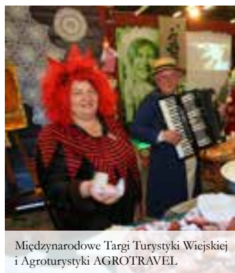
Międzynarodowe Targi Turystyki Wiejskiej i Agroturystyki AGROTRAVEL