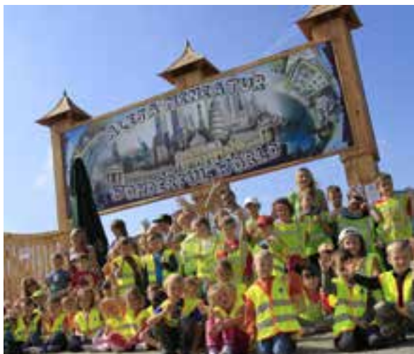
Park Rozrywki i Miniatur Sabat Krajno