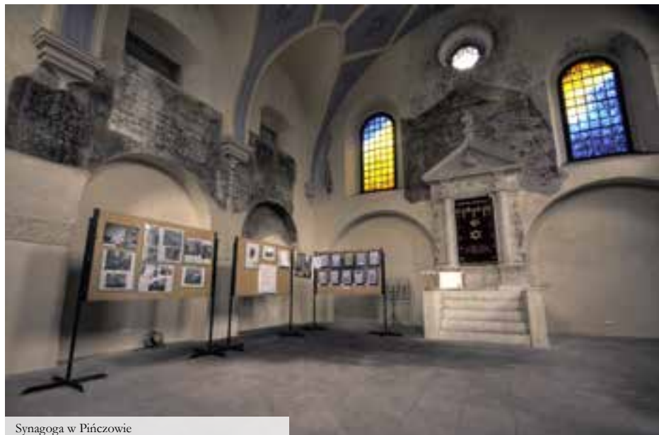
Synagoga w Pińczowie