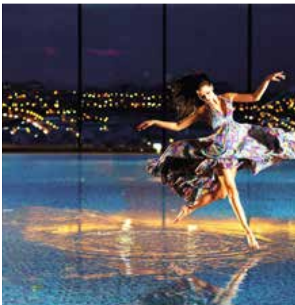
Hotel Odyssey**** w Dąbrowie pod Kielcami