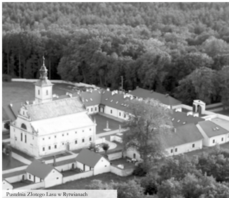
Pustelnia Złotego Lasu w Rytwianach