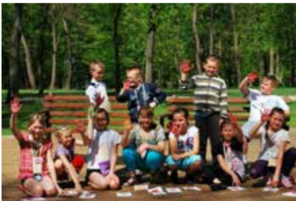
Dom i Biblioteka Sichowska im. Krzysztofa i Zofii Radziwiłłów – warsztaty Wehikul Czasu