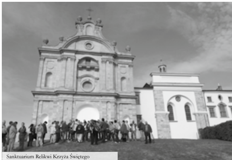
Sanktuarium Relikwi Krzyża Świętego