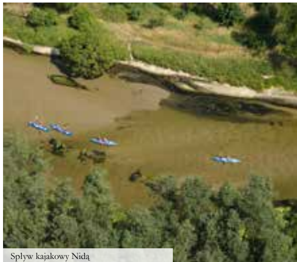
Splyw kajakowy Nidą