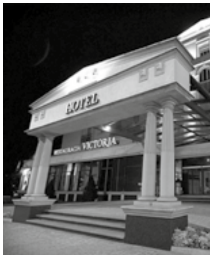
Best Western Grand Hotel****