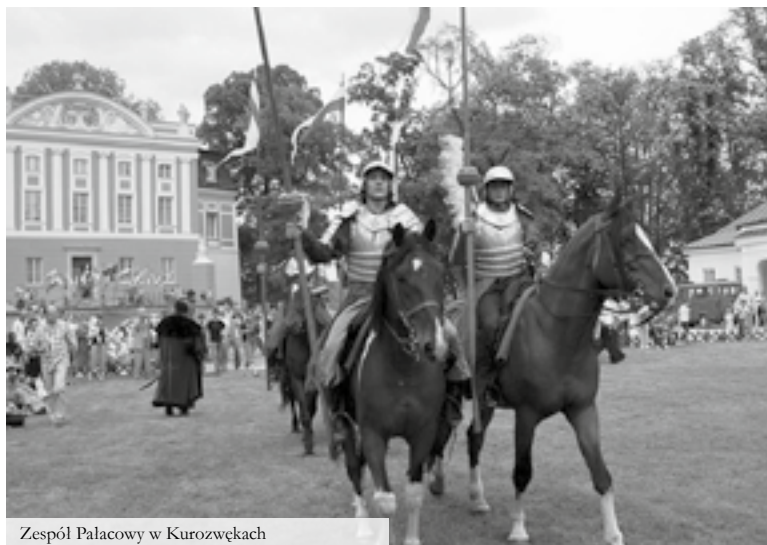
Zespół Pałacowy w Kurozwękach

www.kurozweki.com , rezerwacje@kurozweki.com