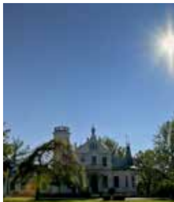
Palacyk Henryka Sienkiewicza w Oblęgorku