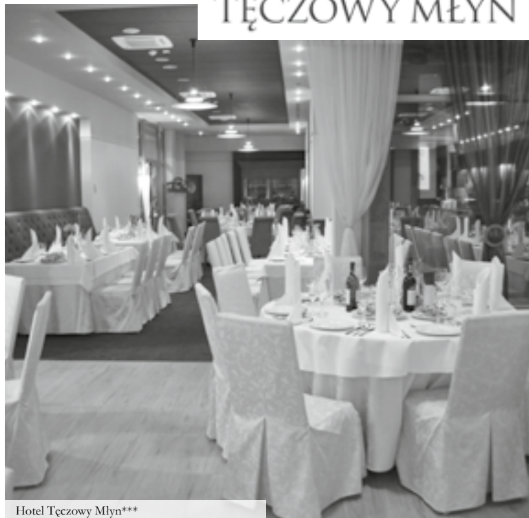
Hotel Tęczowy Młyn***