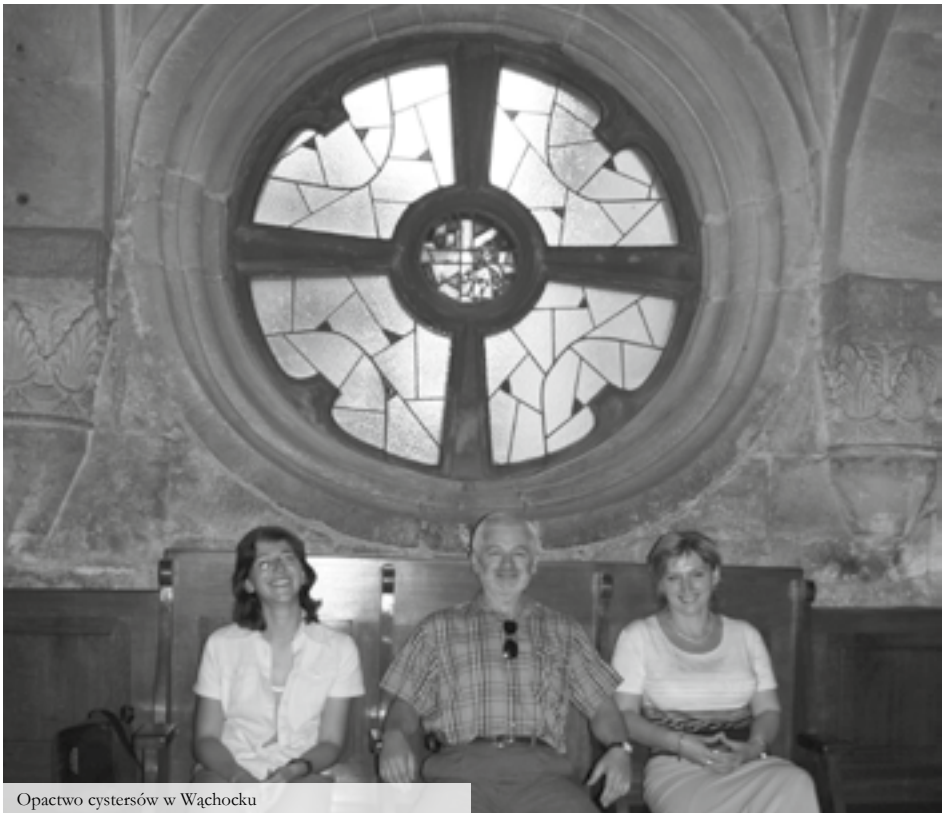
Opactwo cystersów w Wąchocku

e-mail: biuro@szlakprzygody.eu , www.szlakprzygody.eu