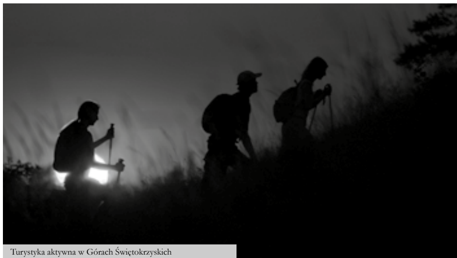
Turystyka aktywna w Górach Świętokrzyskich

Powyższe atrakcje to nie wszystko, co region ma do zaoferowania. Coraz większym zainteresowaniem cieszy się turystyka kajakowa, którą z powodzeniem uprawiać można na łagodnych rzekach Nidzie lub Pilicy. Zimą Świętokrzyskie zaprasza na białe szaleństwo na ośmiu stokach narciarskich, które dostarczą wrażeń każdemu amatorowi białego szaleństwa. Na turystów czekają również stajnie ze szkółkami jeździeckimi, miejsca wspinaczkowe, jaskinie do eksplorowania oraz quady i paintball. Po wypoczynku na świeżym powietrzu, stolica województwa świętokrzyskiego, Kielce, zaprasza na kręgle, bilard, do pubów i dyskotek.