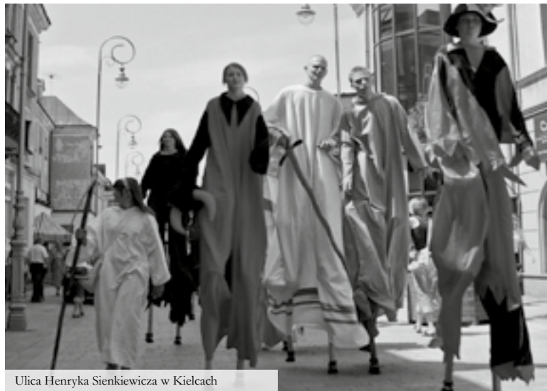
Ulica Henryka Sienkiewicza w Kielcach

www.karczowka.com , www.centrum-geoedukacji.pl , www.muzeumzabawek.eu , www.dolinagadow.pl