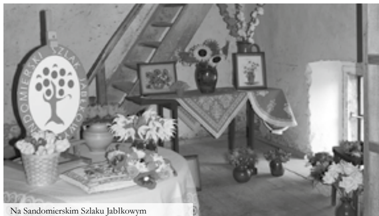
Na Sandomierskim Szlaku Jabłkowym