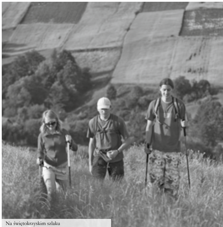
Na świętokrzyskim szlaku