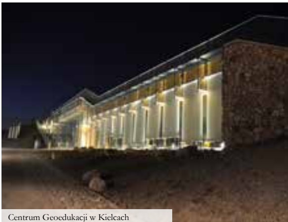
Centrum Geoedukacji w Kielcach