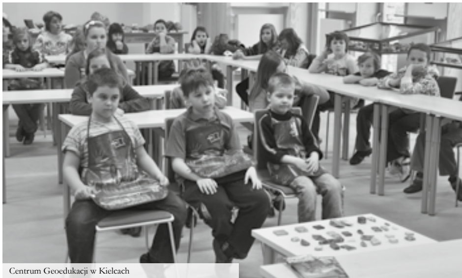
Centrum Geoedukacji w Kielcach

(45 min) warsztaty, podczas których uczniowie poznają tajniki szlifowania wybranych okazów, które następnie jako pamiątkę, zabiorą do swoich domów.