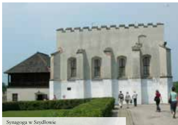
Synagoga w Szydłowie