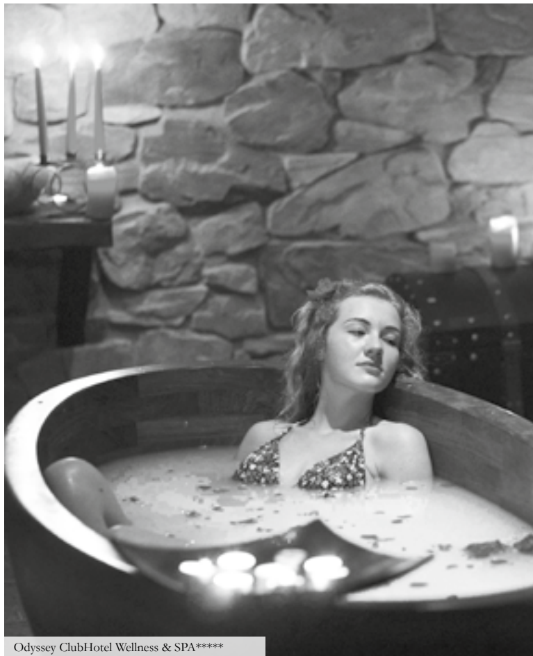
Odyssey ClubHotel Wellness & SPA*****