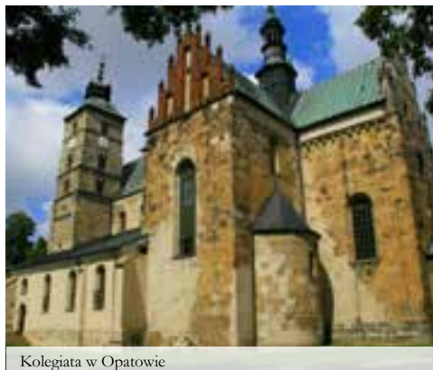
Kolegiata w Opatowie