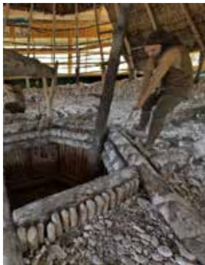
Muzeum Archeologiczne i Rezerwat Krzemionki