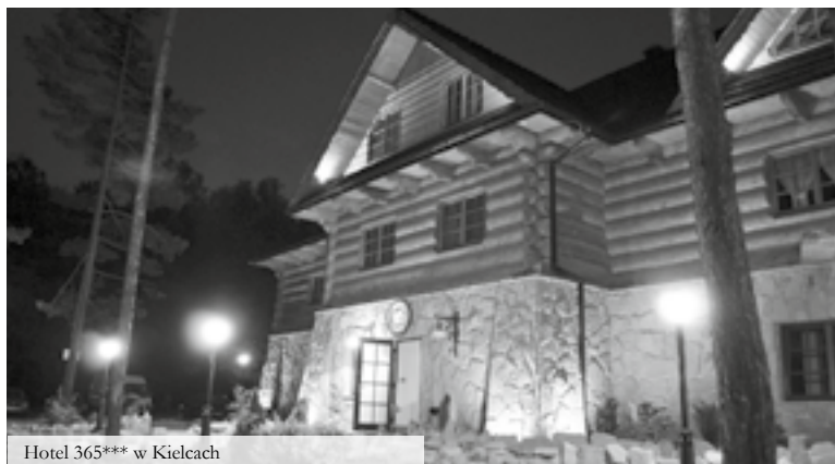
Hotel 365*** w Kielcach

Hotel 365***, al. Na Stadion 365, 25-127 Kielce tel. 41 361 55 55, info@hotel-365.pl , www.hotel-365.pl