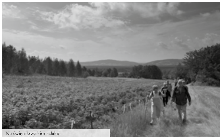
Na świętokrzyskim szlaku

www.swietokrzysz.pl , www.hoteljodelka.pl , www.jaskiniaraj.pl