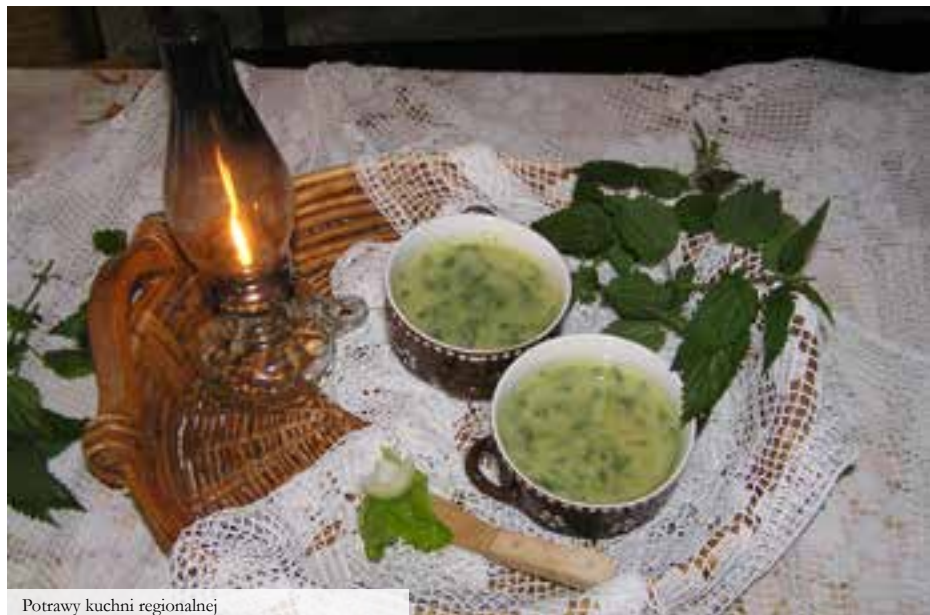
Potrawy kuchni regionalnej