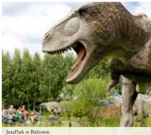
JuraPark w Białtowie