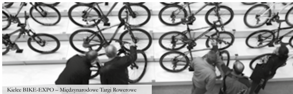
Kielce BIKE-EXPO – Międzynarodowe Targi Rowerowe

Komfortowe zakwaterowanie, smaczne i regionalne żywienia oraz urozmaicony pobyt przyczyni się do podejmowania strategicznych decyzji podczas spotkań biznesowych, bez konieczności rezygnacji z atrakcji, jakie oferuje województwo świętokrzyskie.