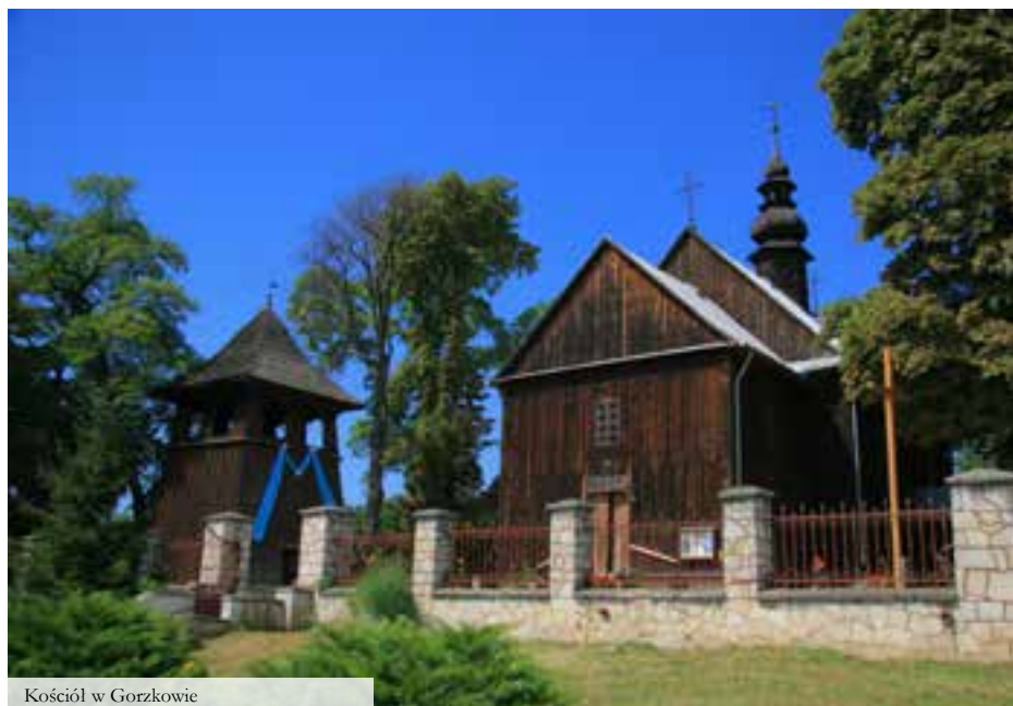
Kościół w Gorzkowie