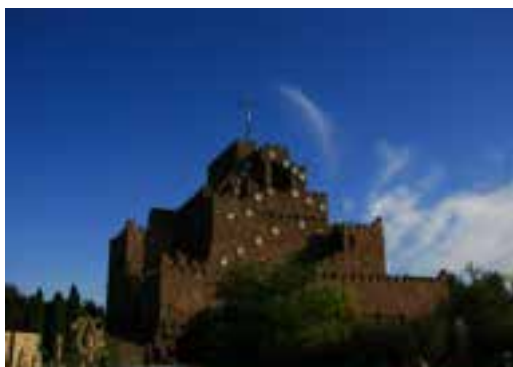
Sanktuarium w Kalkowie-Godowie