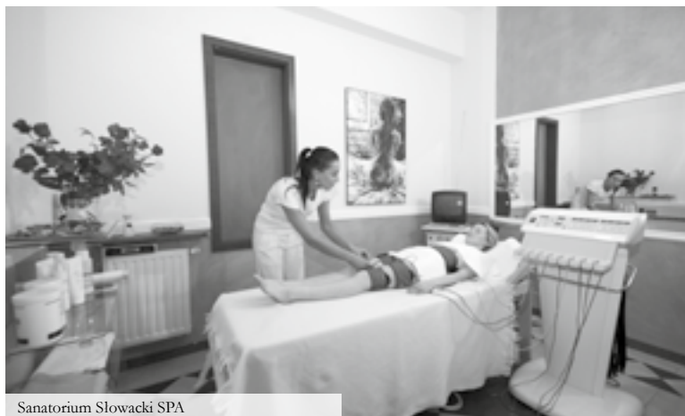
Sanatorium Słowacki SPA