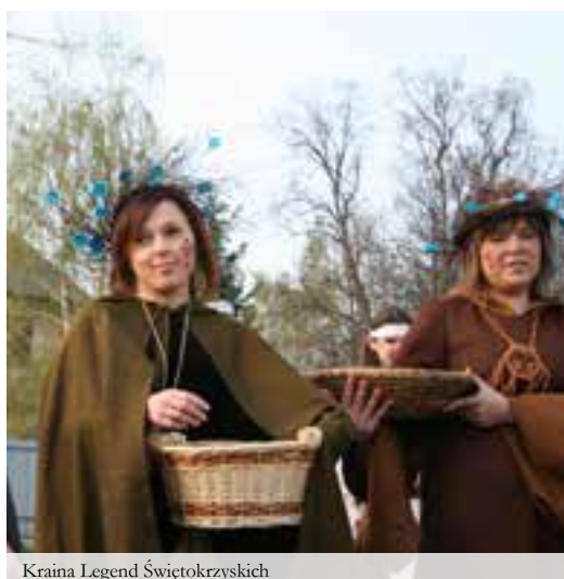
Kraina Legend Świętokrzyskich