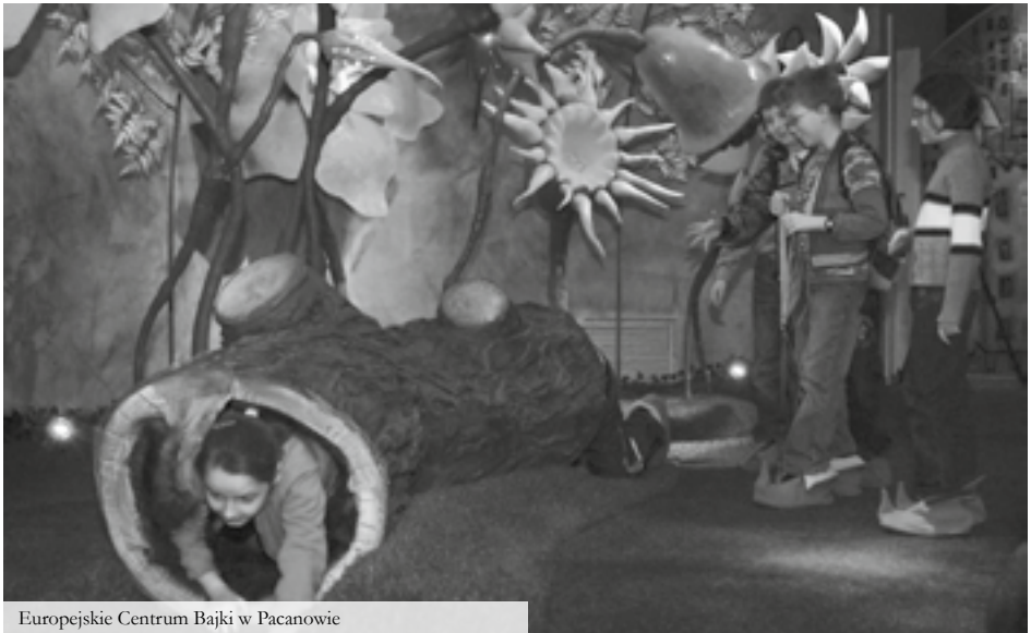
Europejskie Centrum Bajki w Pacanowie

tel. 41 376 50 79, www.rezerwacja.pacanow.eu