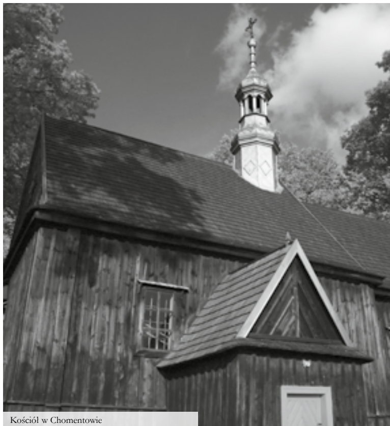
Kościół w Chomentowie