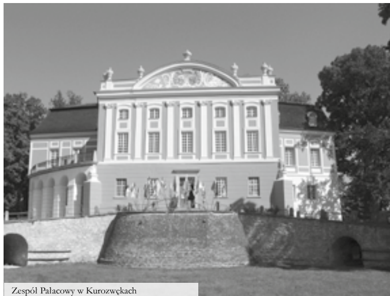
Zespół Pałacowy w Kurozwękach

rezerwacje@kurozweki.com, www.kurozweki.com