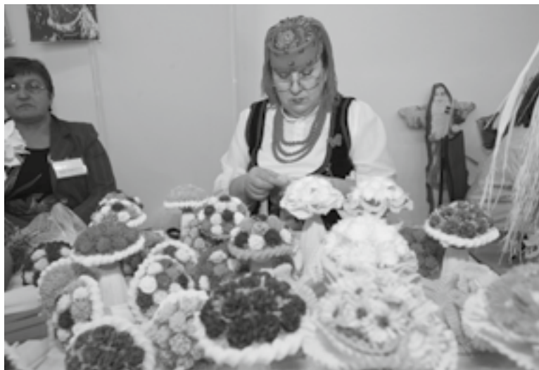
Międzynarodowe Targi Turystyki Wiejskiej i Agroturystyki AGROTRAVEL

*Organizator Targów zastrzega możliwość zmiany docelonych lokalizacji wizyt studyjnych. Szczegóły dotyczące odwiedzanych obiektów znajdują się na oficjalnej stronie internetowej wydarzenia – www.agro.travel