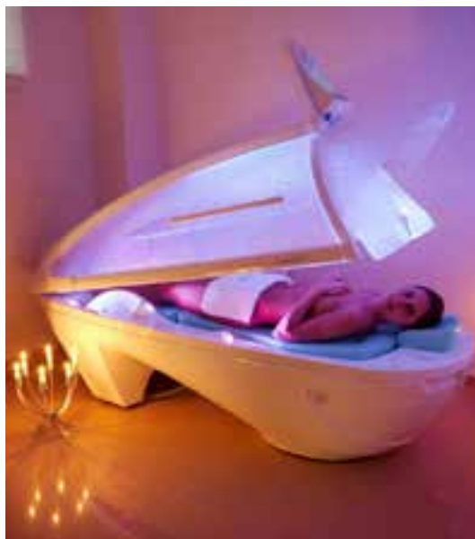
Institut SPA&Beauty w Kielcach