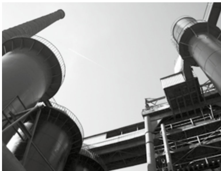
Muzeum Przyrody i Techniki Ekomuzeum w Starachowicach

Oferta przeznaczona dla: zorganizowanych grup dzieci i młodzieży szkolnej oraz turystycznych grup osób dorosłych.