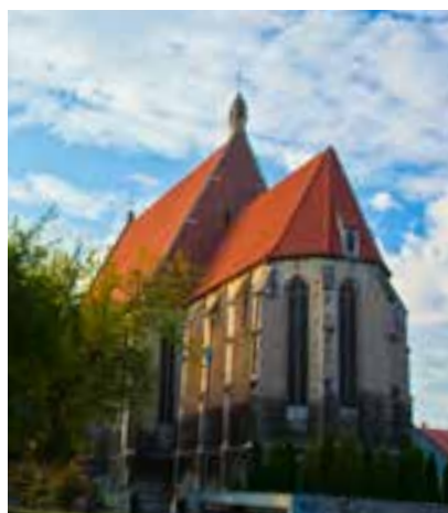
Kolegiata w Wiślicy