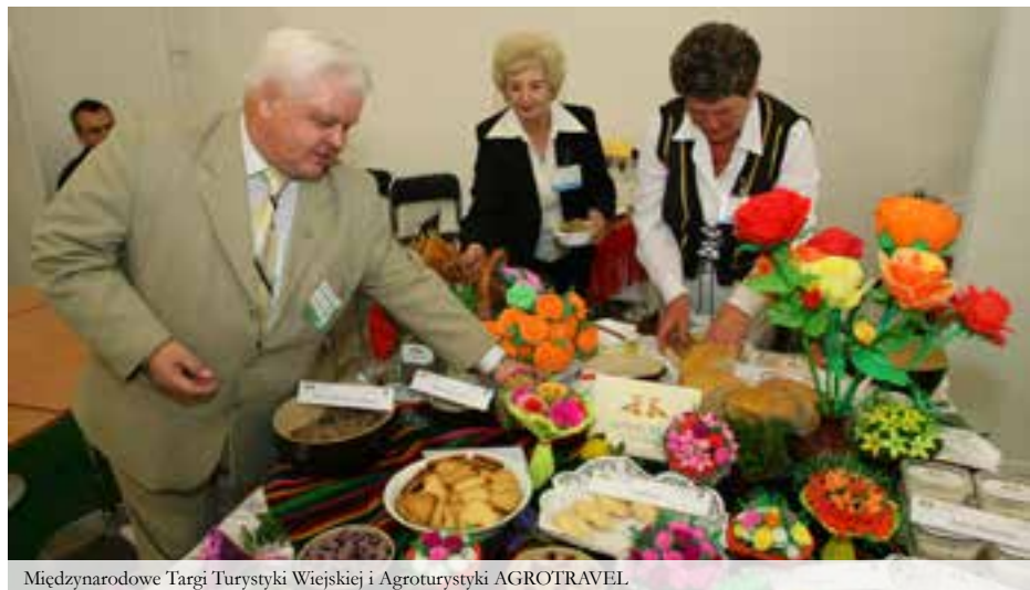
Międzynarodowe Targi Turystyki Wiejskiej i Agroturystyki AGROTRAVEL