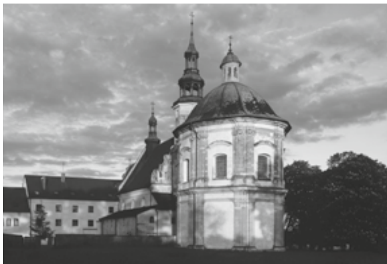
Sanktuarium Matki Bożej Loretańskiej w Piotrkowicach