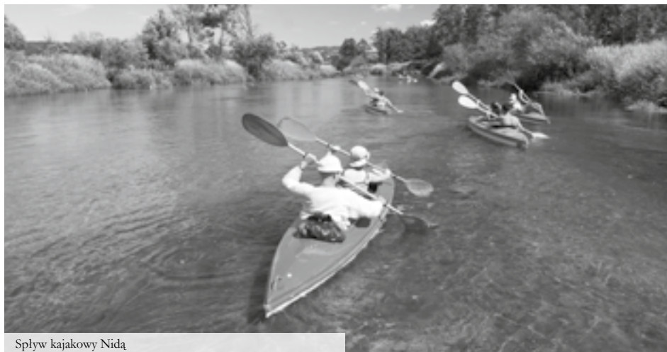
Spływ kajakowy Nidą