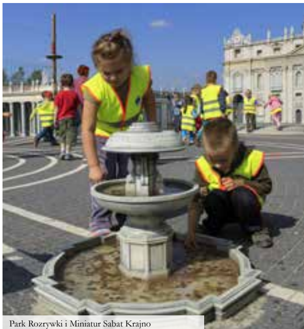
Park Rozrywki i Miniatur Sabat Krajno