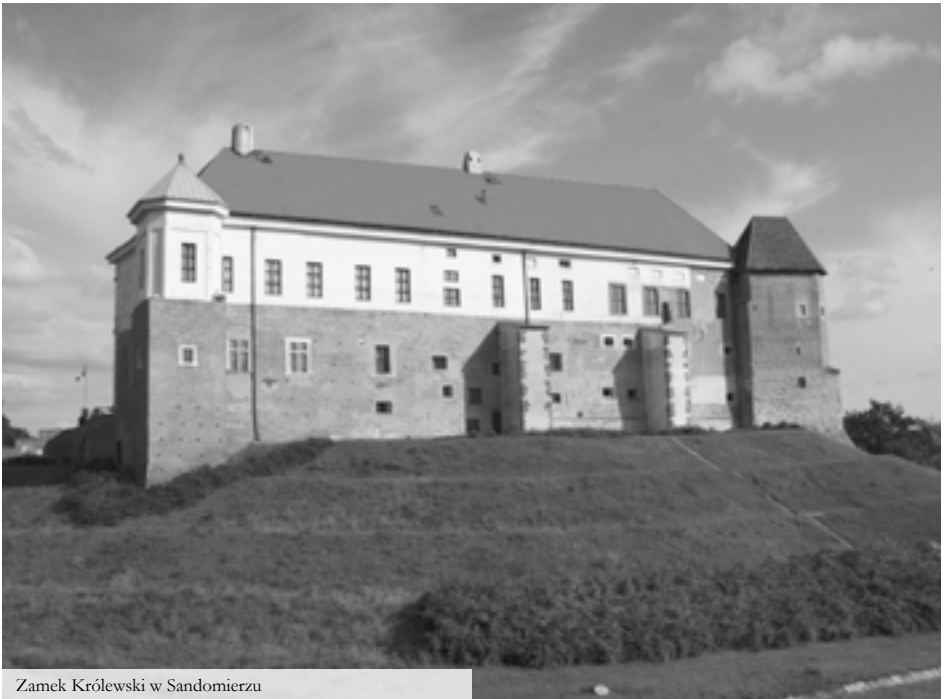
Zamek Królewski w Sandomierzu