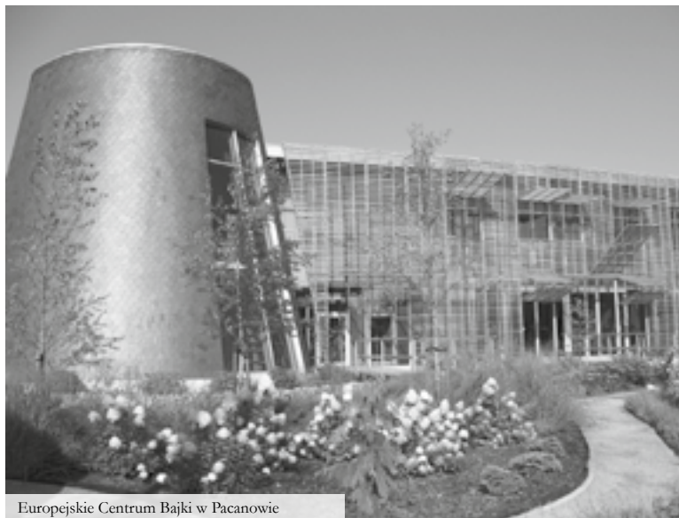
Europejskie Centrum Bajki w Pacanowie