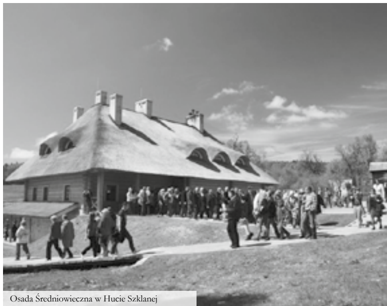
Osada Średniowieczna w Hucie Szklanej