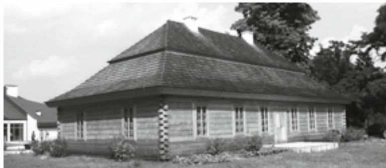
Centrum Edukacyjne Szklany Dom – Dworek Stefana Żeromskiego w Ciekotach

www.szklanydom.maslow.pl , www.swkatarzyna-muzeum.pl , www.hoteljodelka.pl , www.ameliowka.pl