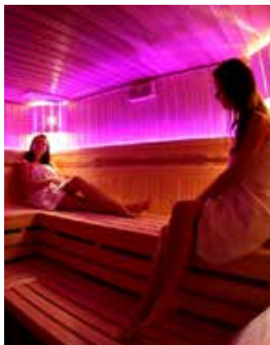
Hotel Aviator w Maslowie