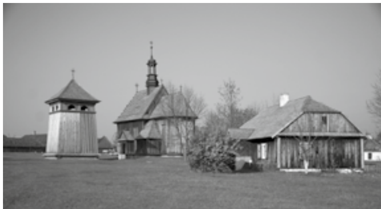
Muzeum Wsi Kieleckiej – Park Etnograficzny w Tokarni