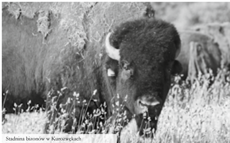
Stadnina bizonów w Kurozwękach

Do dyspozycji gości: restauracja, pizzeria, kawiarnia, bar, plac zabaw, Mini Zoo, stadnina koni, stadnina bizonów, zjeżdżalnia linowa, kort tenisowy, boisko do gry w piłkę nożną, boisko do gry w piłkę plażową.