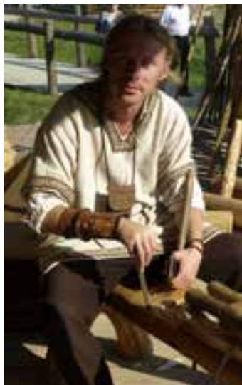
Osada Średniowieczna w Hucie Szklanej