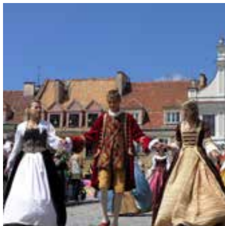
Jarmark Jagielloński oraz Międzynarodowy Turniej Rycerski o Miecz Zawiszy Czarnego z Garbowa