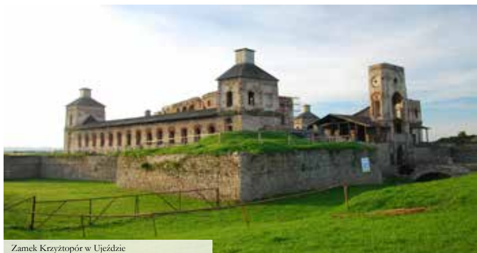
Zamek Krzyżtopór w Ujeździe