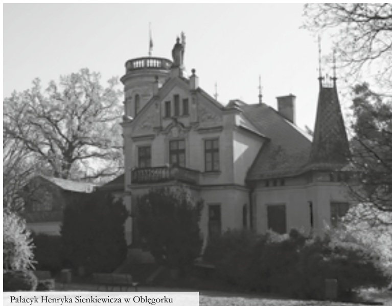
Pałac Henryka Sienkiewicza w Oblęgorku