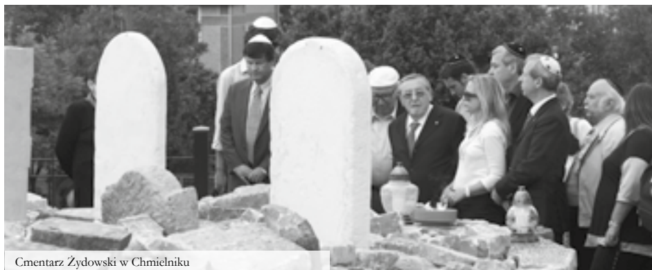
Cmentarz Żydowski w Chmielniku

Z tak bogatym dziedzictwem przeszłości Świętokrzyskie wkroczyło we współczesność, a jego mieszkańcy umiejętnie promują i podkreślają walory województwa. Dlatego też gospodarze regionu dbają o komfortowe warunki zakwaterowania połączone ze smacznym, regionalnym wyżywieniem, co stanowi niezbędną bazę do dobrego samopoczucia i eksplorowania piękna regionu świętokrzyskiego.