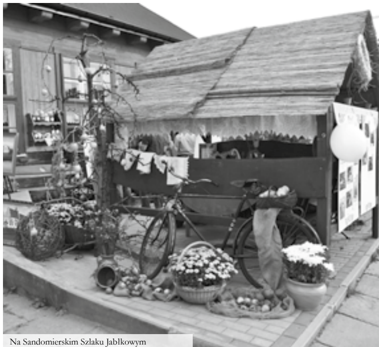
Na Sandomierskim Szlaku Jabłkowym