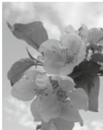
„Szlak Wokół Słońca”

Powyższy opis to projekt „Szlaku Wokół Słońca”, który w latach 2011–2014 uzupełniany będzie kolejnymi przedsięwzięciami Lokalnej Strategii Rozwoju. Dojrzały produkt pod nazwą „Szlak Wokół Słońca” będzie widoczny w 2015 roku.