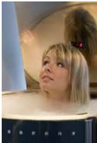
Zabieg w uzdrowisku