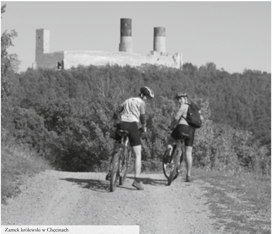
Zamek królewski w Chęcinach