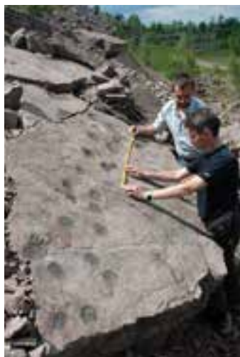
Ślady tetrapoda w rezerwacie Zachelmie