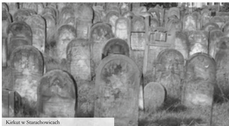
Kirkut w Starachowicach