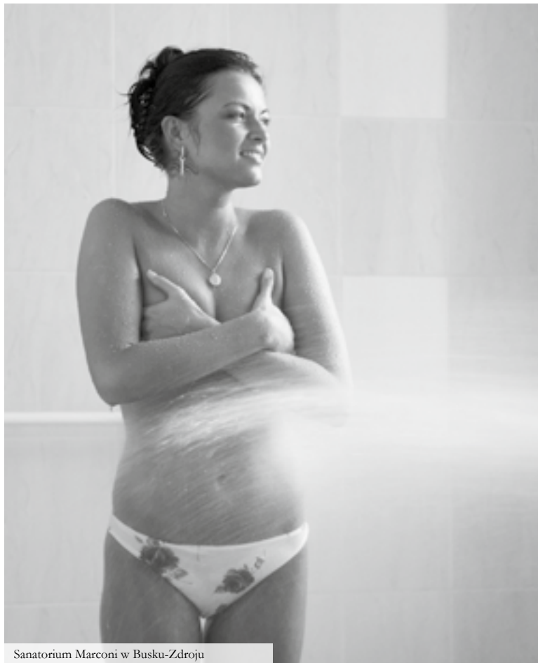
Sanatorium Marconi w Busku-Zdroju