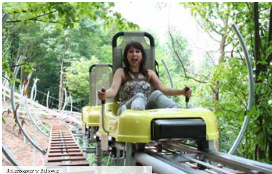
Rollercoaster w Białtowie