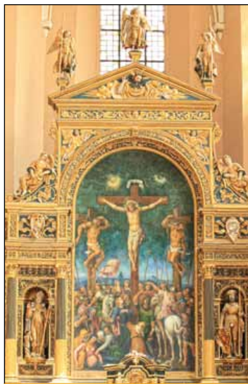
Ołtarz główny w kościele p.w. Wniebowzięcia NMP i Św. Stanisława Biskupa w Bodzentynie