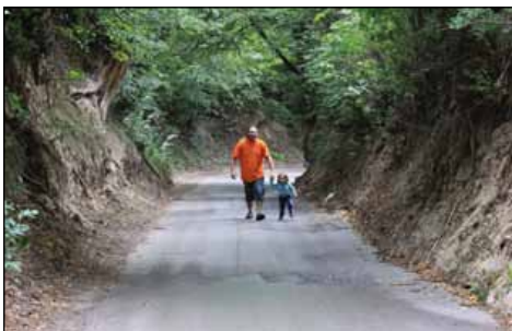
Lessowy wąwóz w Radkowicach

kościół został wzniesiony w 1621 r. w Miedzierz pod Końskimi, a w latach 1958 – 1962 rozebrany i przeniesiony w obecne miejsce. Zachował on częściowo grube, XVII – wieczne szyby – tzw. „ gomółki ”. Na płd. od Radkowic znajduje się rezerwat geologiczny „Wąwóz Chmielowiec” – zbocze wzniesienia poprzecinane jest tu licznymi lessowymi wąwozami, dodatkowo znajdują się tu niewielkie jeziora oraz tereny bagienne z miej-