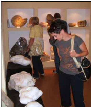
Galeria Mineralów i Skamieniałości w Świętej Katarzynie