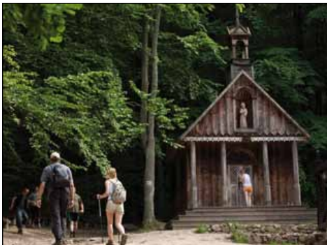
Kaplica p.w. Św. Franciszka w Świętej Katarzynie