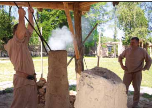
Inscenizacja w Parku Kulturalno-Archeologicznym w Nowej Słupi

Wytopy rudy żelaza odbywały się w prymitywnych, jednorazowych piecach, zwanych dymarkami.