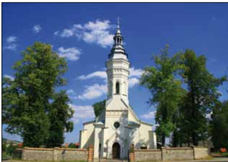
Kościół w Leszczynach