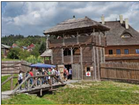
Osada średniowieczna w Hucie Szklanej

Docieramy do parkingu w Hucie Szklanej (możemy też przy gołoborzu