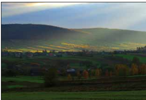
Widok na Pasma Klonowskie spod kapliczki św. Barbary

się kapliczka p.w. św. Barbary z poł. XIX w. , wystawiona tu na cześć swojej patronki przez górników, wydobywających w okolicy rudę żelaza. Warto zatrzymać się na parkingu przy kapliczce, by podziwiać rozciągający się stąd wspaniały widok na Dolinę Bodzentyńską oraz Pasma – Klonowskie i Łysogórskie . ORZECZÓWKA Znajduje się tu kolejne nietuzinkowe gospodarstwo agroturystyczne , w którym zwiedzić możemy – ponoć „ jedyne w Polsce, a może i w Europie ” – „ Muzeum Siekier ”. W gospodarstwie znajduje się także kuźnia , w której możemy oglądać pokazy i nauczyć się sztuki kowalstwa oraz płatnerstwa. Gospodarz zajmuje się również ziołolecznictwem, wyrabiając m.in. przeróżne nalewki (tel. 603 427 282; www.orzechowka.prv.pl ). Natomiast idąc z parkingu – za znakami rozpoczynającego się tu pieszego szlaku turystycznego, oznaczonego kolorem czarnym – dotrzeć możemy w pobliże szczytu Góry Kamień Michniowski (435 m n. p. m.), na terenie której w 1978 r. utworzono – na pow. 10,50 ha – rezerwat leśny o ochronie częściowej, nazwany „ Kamień Michniowski ”.