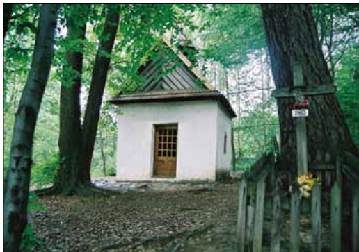
Kapliczka Żeromskiego (Janikowskich) w Św. Katarzynie