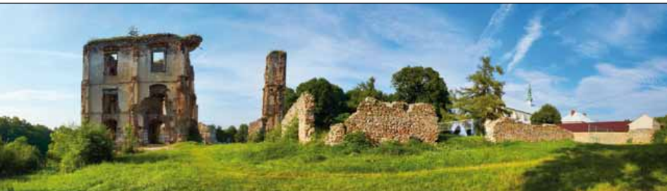
Ruiny zamku w Bodzentynie