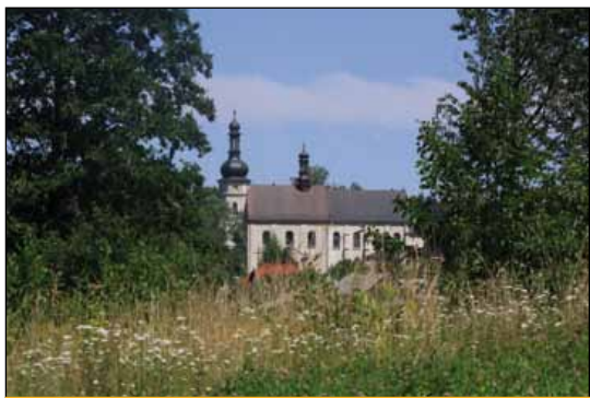
Kościół we Wzdole