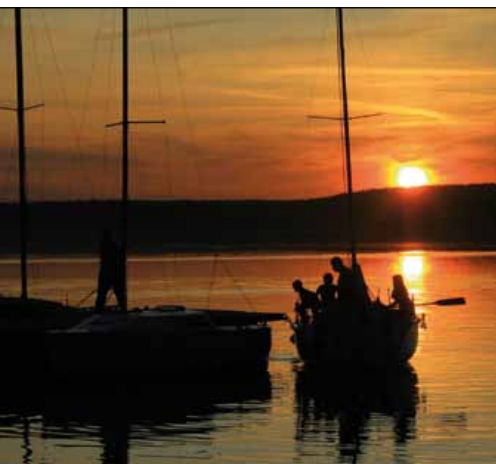
Zalew w Cedzynie

Z parkingu w Cedzynie wyjeżdżamy – skręcając w prawo – na drogę, biegnącą w kier. płn. – wsch. (kier. św. Katarzyna) – wzdłuż wsch. linii brzegowej zalewu, a następnie wyjeżdżamy do miejscowości Leszczyny. Po prawej mijamy gospodarstwa, mieszczące pokoje gościnne oraz lokal gastronomiczny. Utrzymując kier. wsch., docieramy do – górującego nad skrzyżowaniem z drogą wojewódzką 745 – kościoła parafialnego w Leszczynach, gdzie zatrzymujemy pojazd na przykościelnym parkingu.