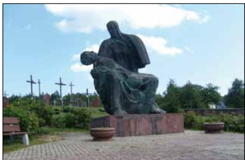
Muzeum Martyrologii Wsi Polskiej

W dniach 12 i 13 VII 1943 r. niemieccy oprawcy dokonali tu jednej z najbardziej okrutnych pacyfikacji na ziemiach polskich. Zastrzelono i spalono żywcem wówczas 203 osoby, wśród których było ponad 50 kobiet i ponad 40 dzieci. Dziś znajduje się tu – w centrum wsi – Muzeum Martyrologii Wsi Polskiej , stanowiące od 1999 r. Oddział Muzeum Wsi Kieleckiej , na terenie którego zobaczymy możemy m.in.: zbiorową mogiłę ; pomnik „Pieta Michniowska” ; muzealny