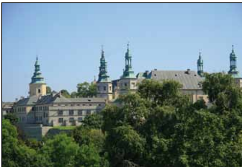
Wzgórze Zamkowe w Kielcach