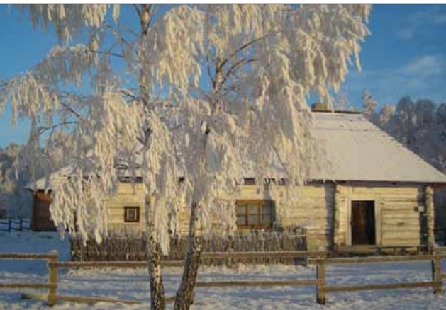
Zabytkowa chałupa w Kakoninie

Na pld. od Bieliny – wzdłuż drogi krajowej 74 (trasy Kielce – Łagów – Lublin) – rozciągnęły malowniczo swe zabudowania miejsowości: Skorzeszyce, Smyków, Napęków, Belno, Makoszyn, Lechów, Lechówek i Małacentów . Do dziś w tym rejonie możemy obserwować ślady działalności górniczo-hutniczej , w postaci resztek zwałów