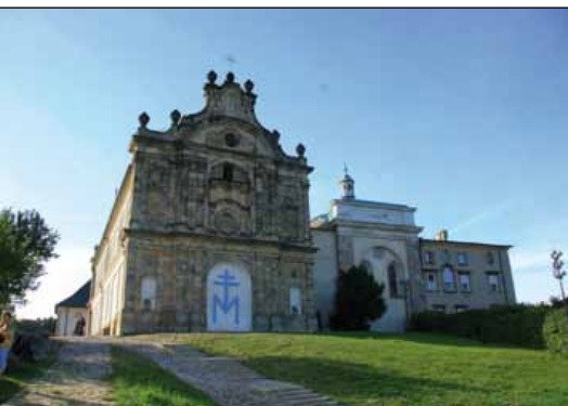
Klasztor Świętego Krzyża na Łęścu

górami) oraz częściowo płn.-wsch. i płd.-wsch. Po prawej wznosi się wolno stojąca dzwonnica z kwarcytowych ciosów mająca metrykę XVIII – wieczną. Obecny kościół świętokrzyski wzniesiono na przełomie XVIII i XIX w. – na zrębach rozebranego po pożarze z 1777 r. kościoła wcześniejszego (sięgającego metryką epoki romanizmu). Prace budowlane rozpoczęte w latach 80. XVIII w. wraz z wykończeniem wnętrza nowej świątyni trwały ponad dwadzieścia lat i dopiero w roku 1806