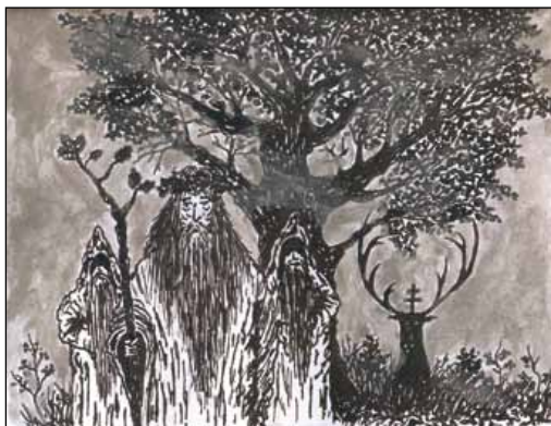
Św. Krzyż - święty gaj pogański

Jak już wiemy, naukowcy twierdzą, że w czasach przedchrześcijańskich na szczycie Łysej Góry znajdowała się pogańska świątynia, w której za czasów słowiańskich miano oddawać cześć bożkom związanym z siłami przyrody. Najczęściej wymienia się bóstwa, noszące nazwy: Łada, Boda i Lela, albo – Świst, Poświst, Pogoda oraz Lelum i Polelum. Nie mamy dziś pewności, kiedy dokładnie na szczycie Łysej Góry stała pierwsza chrześcijańska świątynia. Naukowcy spierają się o to po dziś dzień, jednak większość z nich uważa, że kościół i klasztor benedyktyński wzniesiono tu najprawdopodobniej za czasów panowania Bolesława Krzywoustego, czyli w 1. poł. XII w. Kwestionując tym samym chyba najśłynniejszą, a rozpropagowaną przez J. Długosza