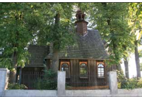
Kaplica w Dąbrowie

nad osadą króluje Góra Stróżna , zwana także Strużyną , a zapisywana też często – Strużna (367 m n.p.m.). MASŁÓW. Przy głównej ulicy osady położone jest lotnisko Aeroklubu Kieleckiego , powstałe w okresie międzywojennym. Dnia 3 VI 1991 r. połową mszę świętą, pośród morza wiernych, odprawił tu, podczas swej IV Pielgrzymki do Ojczyzny, Papież Polak – Jan Paweł II. To wiekopomne wydarzenie upamiętnia tw. „Kamień Pielgrzyma” , czyli – ustawiony w 2006 r. na wybrukowanym placu na terenie lotniska – obelisk w formie czarnej, pionowo stojącej, granitowej płyty . Więcej szczegółowych informacji znajdziemy pod nr tel.: 41 311 08 93 . Powyżej wznosi się neogotycki kościół parafialny p.w. Przemienienia Pańskiego, wzniesiony w latach 1926-1938. DĄBROWA. Zobaczyć tu możemy współczesny kościół parafialny , a także drewnianą kaplicę o konstrukcji zrębowej, wybudowaną ok. poł. XIX stulecia . W okolicy znajdują się znaczne ślady dużych i mniejszych