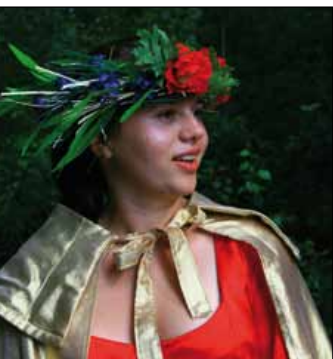
Kraina Legend Świętokrzyskich

W Bielinach i okolicach organizowane są również gry terenowe zwane „ Krainą Legend Świętokrzyskich ”. Organizacją gier na zamówienie zajmuje się: Centrum Tradycji i Turystyki Gór Świętokrzyskich, ul. Partyzantów 3, 26-004 Bieliny, tel.: 41 260 81 51–57, http://www.osadasredniowieczna.eu .