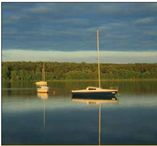
Zalew w Cedzynie

dojazdowej, która powiedzie nas – między leśnymi drzewami – w kier. pń.-wsch. – ku kolejnemu obiektowi noclegowo-gastronomicznemu – Hotelowi „Echo” . Obecnie jest to hotel nowoczesny, przystosowany zarówno dla gości niepełnosprawnych, jak i pełnosprawnych, dysponujący ok. 100 miejscami noclegowymi – w pokojach 1 i 2 os., apartamentach oraz pokojach tzw. „ ekonomicznych ” i „ rodzinnych ” – a ponadto restauracją, kawiarnią (także letnią), salami konferencyjnymi i bankietowymi, sauną, siłownią, salą masażu i salą rehabilitacyjną. Obok – po przeciwnej stronie drogi dojazdowej (którą zmierzamy) – w otoczeniu leśnych drzew – ujrzymy zadaszony krąg ogniskowy poprzedzony oryginalną, drewnianą, rzeźbioną ludycznie bramą . Utrzymując obrany wcześniej kierunek i trzymając się tej samej drogi, opuszczamy teren Hotelu Echo, by prawie natychmiast wkroczyć w dziedzinę sąsiedniego Hotelu „Uroczysko” . Hotel ten dysponuje m.in. 100 miejscami noclegowymi – w pokojach 1 i 2 os., apartamentach i pokojach typu studio, restauracją, kawiarnią, salami konferencyjnymi, sauną, siłownią, stołami bilardowymi, kortem tenisowym, boiskami do gry w siatkówkę i koszykówkę, rowerami oraz miejscem ogniskowym. Idąc wzdłuż Hotelu Uroczysko, mijamy po prawej stronie drogi parking strzeżony i docieramy do skraju lasu oraz ogrodzenia, za którym widać już drogę asfaltową – prowadzącą od zalewu w kierunku miejscowości Leszczyny.