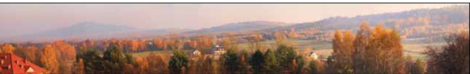
Widok na Góry Świętokrzyskie spod Schroniska w Mąchocicach Scholasterii

Wyjeżdżamy z powrotem na trakt kielecki, obierając kier. Ciekoty – Święta Katarzyna, by dotrzeć do skrzyżowania z drogą, wiodącą – w lewo – do wsi Mąchocice – Scholasteria. Skręcamy w nią i docieramy do słynnej szkoły – pomnika Stefana Żeromskiego. Działające w budynku Szkolne Schronisko Młodzieżowe PTSM – kategorii I – dysponuje 52 miejscami noclegowymi i oferuje przez cały rok turystom tanie noclegi w pokojach 2, 3 i 5 osobowych. Ceny noclegów za dobę kształtują się następująco: młodzież szkolna, nauczyciele, studenci – ok. 15 zł, z pościelą – ok. 21 zł; pozostali goście – ok. 19 zł, z pościelą – ok. 25 zł. Tel. 41 311 11 04, 311 11 05, fax. 41 311 10 64; e-mail: scholasteriaszkola@op.pl; www.ssm.strefa.pl. Spod szkoły – pomnika S. Żeromskiego wracamy na trakt kielecki, by kontynuować podróż w kier. płn. – kier. Ciekoty – Święta Katarzyna. Przejeżdżamy przez most na rzece Lubrzance i powoli wjeżdżamy na szerokie terytorium Doliny Wilkowskiej. Pokonawszy kolejny rzeczny most, docieramy do skrzyżowania dróg w centrum miejscowości Ciekoty pięknie położonej u podnóża Góry Radostowa (451 m n.p.m.). Pojazd pozostawiamy na parkingu.