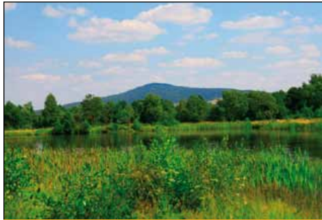
Ciekoty – widok na Łysicę