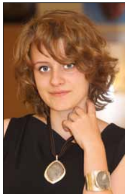
Prezentacja biżuterii z krzemienia pasiastego