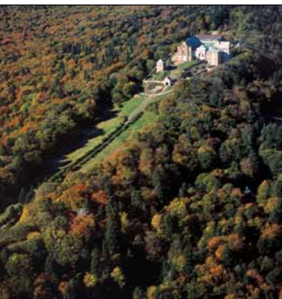
Klasztor Świętego Krzyża

Zbawiciela. Ściany kaplicy pokrywają XVIII – wieczne malowidła iluzjonistyczne, przedstawiające legendarną historię relikwii Drzewa Krzyża Świętego , związaną z ich wędrówką z Jerozolimy poprzez Konstantynopol i Węgry do Polski, i wreszcie do klasztoru łysogórskiego. Przy płd. ścianie kaplicy Oleśnickich dumnie prezentuje się przepiękny, późnomanierystyczny, piętrowy, pomnik nagrobny fundatorów kaplicy – rodziny Oleśnickich – którzy spoczęli w krypcie pod posadzką. Nagrobek ten wykonany jest – podobnie jak ołtarz główny – w marmurze checińskim z dodatkami marmuru czarnego i alabastru. W centralnej jego części znajdują się dwie płyty z płaskorzeźbami leżących postaci : u góry – Mikołaja Oleśnickiego, zaś na dole jego małżonki – Zofii. Wycho-