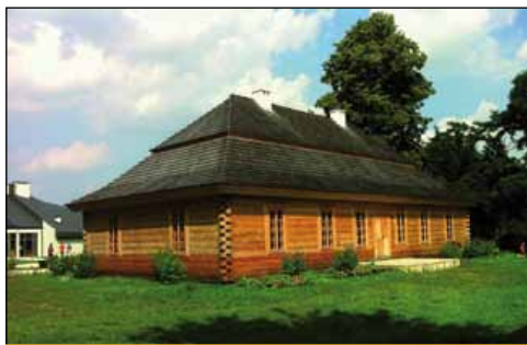
Dworek w Ciekotach

– która obecnie znajduje się w zbiorach Muzeum Lat Szkolnych Stefana Żeromskiego w Kielcach. Obok zrekonstruowanego dworu – opodal jego płd. ścian – stoi pamiętkowy kamienny obelisk, na którym wyryto okrojony cytat z ostatniego dzieła Stefana Żeromskiego „Puszcza jodłowa” . Pod koniec 2007 r. rozpoczęto przygotowania do budowy na Żeromszczyźnie „Szklanego Domu” . Jesienią roku 2010 był on gotowy i wraz rekonstrukcją dworu polskiego został oddany do użytku. Budowli nadano nowocześniejszą i jednocześnie dość surową formę.