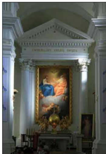
Wnętrze kościoła p.w. Trójcy Świętej i Krzyża Świętego