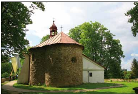
Kościół w Grzegorzowicach

nie jasno otynkowanej – wybudowanej jako nawa w 1.pół. XVII wieku. Starsza część obecnego kościoła – pierwotna tutejsza świątynia – została z pewnością wybudowana w średniowieczu. Prawdopodobnie (na co zdają się wskazywać wyniki prac archeologicznych) wzniesiono ją na przełomie XIII i XIV wieku. Wyposażenie i wystrój wnętrza świątyni pochodzi w zdecydowanej większości z okresu baroku. Rotunda –