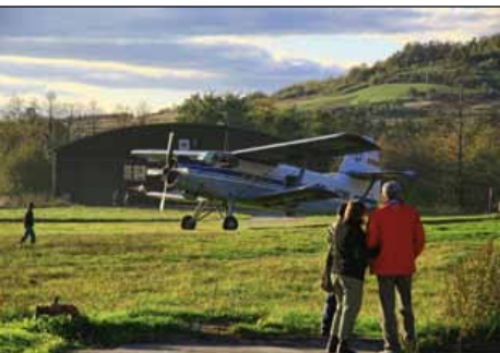
Lotnisko w Masłowie

BĘCZKÓW. Zobaczyć tu możemy młyn z 2.poł. XIX w. i zabytkowe kapliczki (w przysiółku Górka ) oraz ciekawą skalkę (znajdującą się na płn. od kościoła – przy skrzyżowaniu dróg), natomiast od wsch.