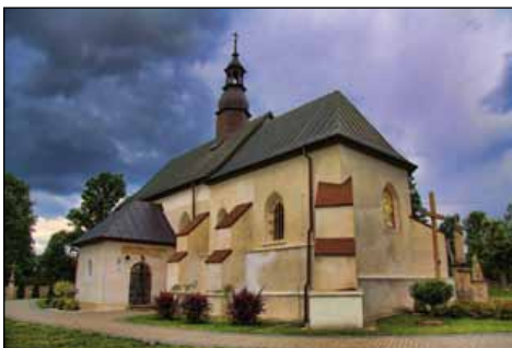
Kościół w miejscowości Świętomarz

RADKOWICE Do naszych czasów dotrwał w Radkowicach zespół podworski , w skład którego wchodzi m.in.: dwór z 2. poł. XIX w., stodoła z poł. XIX w. oraz pozostałości parku z XVIII w. , przekształconego w XIX w., w którym rosną m.in. 3 ok. 300 – letnie wiązy – pomniki przyrody . Na uwagę zasługuje też miejscowy kościół parafialny p.w. Matki Bożej Częstochowskiej . Ten drewniany kościół został wzniesiony w 1621 r. w Miedzierz pod Końskimi, a w latach 1958 – 1962 rozebrany i przeniesiony w obecne miejsce. Zachował on częściowo grube, XVII – wieczne szyby – tzw. „ gomółki ”. Na płd. od Radkowic znajduje się rezerwat geologiczny „Wąwóz Chmielowiec” – zbocze wzniesienia poprzecinane jest tu licznymi lessowymi wąwozami, dodatkowo znajdują się tu niewielkie jeziora oraz tereny bagienne z miej-