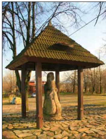
Figura Emeryka w Nowej Słupi

Natomiast u samych bram Puszczy Jodłowej – powyżej Muzeum Starożytnego Hutnictwa – znajdziemy budynek Szkolnego Schroniska Młodzieżowego PTSM „Pod Pielgrzymem”, wzniesiony w okresie międzywojennym , a także kamienną figurę kłęczą-