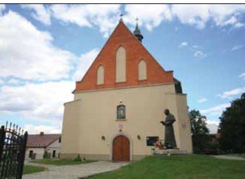
Kościół Św. Ducha w Bodzentynie

nistówki), w którym jesienią 1914 r. mieściła się kwatera Komendanta Legionów – Józefa Piłsudskiego.