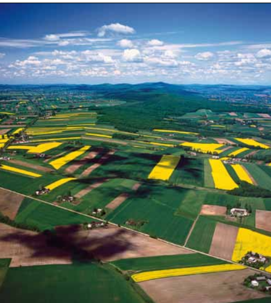
Panorama Pasma Jeleniowskiego i Łysogór