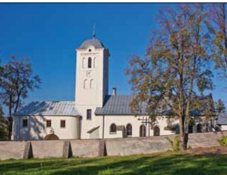
Klasztor i kościół w Świętej Katarzynie

Boża Wola Górskiego – z dnia 15 VI 1815 r. klasztor nadany został Bernardynom. Zespół klasztorny – po przebudowach, spowodowanych głównie zniszczeniami po pożarach – dawno temu zatracił pierwotne formy architektoniczne. Dobudowane od zach. do fasady kościoła w 1633r. późnorenesansowe obejście krużgankowe , okalające niewielki wirydarz, ocalałe z pożaru 1847 r., stanowi obecnie jedyne, tak okazałe i wyraźnie widoczną, zabytkową część. Krużgankowe obejście posiada sklepienie kolebkowo-krzyżowe i zachowały się w nim późnorenesansowe, kamienne porta-