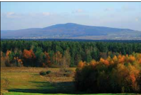
Widok na Łysicę z Klonowa