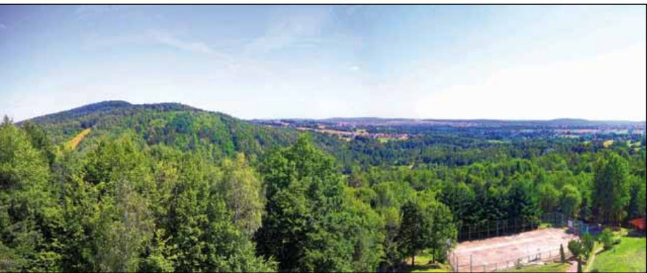
Widok na Radostową z hotelu Przedwiośnie