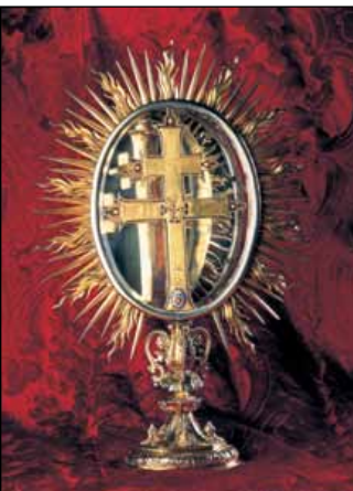
Relikwiarz z fragmentem Drzewa Krzyża Chrystusowego