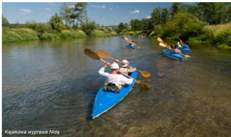
Kajakowa wyprawa Nidą

Definicja zdrowia przyjęta przez Światową Organizację Zdrowia