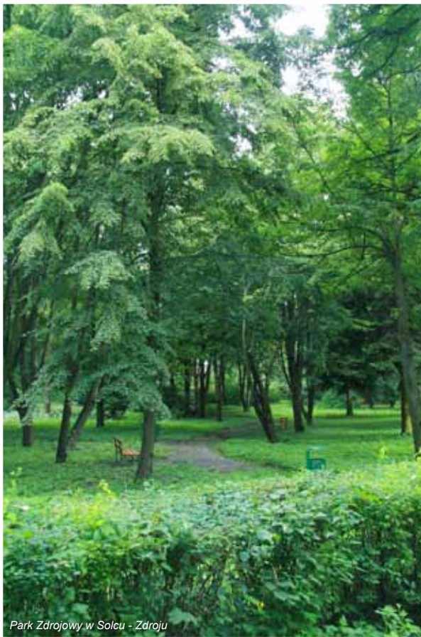
Park Zdrojowy w Solcu - Zdroju

Wykorzystywana do leczenia woda siarczkowa posiada stężenie jonów siarczkowych na poziomie 103 mg/litr. Leczone są tu takie schorzenia jak: reumatoidalne zapalenia oraz zwyrodnienia stawów, zeszywniające zapalenia stawów kręgosłupa, gościec tkanek miękkich, stany pourazowe, dyskopatie, zapalenie korzonków nerwowych, nerwobóle, dna moczanowa, choroby skóry, choroby układu oddechowego, choroby układu krążenia, zatrucia metalami ciężkimi i osteoporoza.