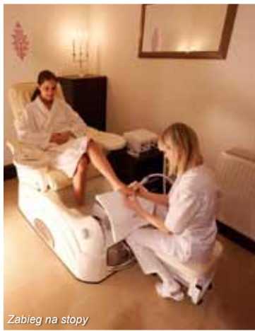
Zabieg na stopy

Na terenie Instytutu dostępne są bezpłatnie: szlafroki, ręczniki, klapki i bielizna jednorazowa.