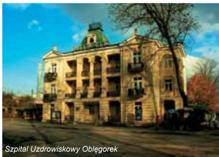
Szpital Uzdrowiskowy Oblęgorek

Szpital Uzdrowiskowy „Oblęgorek” mieści się w pięknym, zabytkowym obiekcie wybudowanym w 1903 roku. Leczy się tu pacjentów ze schorzeniami skóry. Szpital posiada bazę zabiegową z najnowocześniejszym w kraju sprzętem i aparaturą do fototerapii, czyli światłolecznictwa.