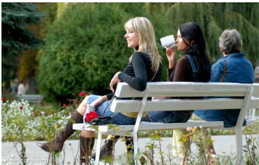
W parku zdrojowym

Sanatorium Astoria to nowoczesny obiekt posiadający 120 miejsc sanatoryjnych. Odbywają się tu kąpiele - siarczkowe, borowinowe, kwasowęglowe, zawijania borowinowe, hydromasaże, kąpiele ozonowo-perełkowe, masaż klasyczny i wibracyjny, zabiegi w oparciu o prąd impulsowy, interferencyjny, ultradźwięki, magnetronik, krioterapia, inhalacje, gimnastyka i wiele innych.