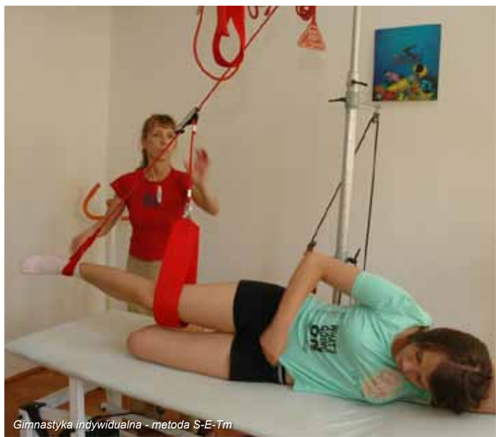
Gimnastyka indywidualna - metoda S-E-Tm

Przy użyciu tych naturalnych tworzyw leczniczych bardzo skutecznie leczy się w Busku choroby narządów ruchu i reumatyczne, choroby skóry, choroby układu krążenia. Jest to podstawowy profil leczniczy uzdrowiska.