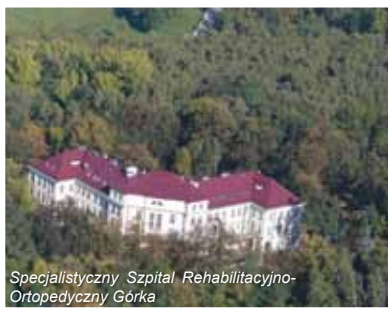
Specjalistyczny Szpital Rehabilitacyjno-Ortopedyczny Górka

Oferujemy zabiegi endoprotezoplastyki stawu kolanowego i biodra. Udzielamy świadczeń w ramach umowy z NFZ jak i na zasadach odpłatności przez pacjenta. Leczymy pacjentów z mózgowym porażeniem dziecięcym. Placówka jest liderem w Polsce leczeniu tego schorzenia. W Szpitalu udzielane są świadczenia kompleksowo, po zabiegach pacjenci na miejscu mają do dyspozycji w pełni profesjonalną rehabilitację. Zajmujemy się też takimi zabiegami jak; usuwanie przykurczów stawów, wydłużanie, skracanie i przeszczepianie mięśni, korygowanie osi kończyn, wydłużanie i skracanie kości. Operujemy skrzywienia kręgosłupa, wadliwie ukształtowanie klatki piersiowej (kurza, lejkowata), wrodzone zwichnięcia stawów biodrowych, wrodzone stopy końsko-szpotałe i płasko-koślawe. Leczone są też stany po zapaleniach kości oraz wadliwie wygojone złamania.