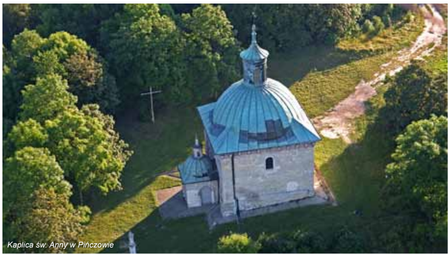
Kaplica św. Anny w Pińczowie