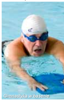
Gimnastyka w basenie

ul. 1-go Maja 39, 28-100 Busko-Zdrój tel. 041 370 32 73