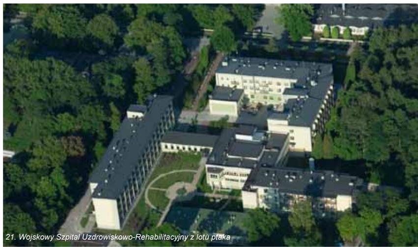
21. Wojskowy Szpital Uzdrawiskowo-Rehabilitacyjny z lotu ptaka

21. Wojskowy Szpital Uzdrawiskowo-Rehabilitacyjny ul. F. Rzewuskiego 8, 28-100 Busko-Zdrój Informacja i rezerwacja miejsc pełnopłatnych: tel. 041 378 03 85, e-mail: rezerwacja@21wszur.pl tel. recepcji, centrali: 041 378 24 17, www.21wszur.pl