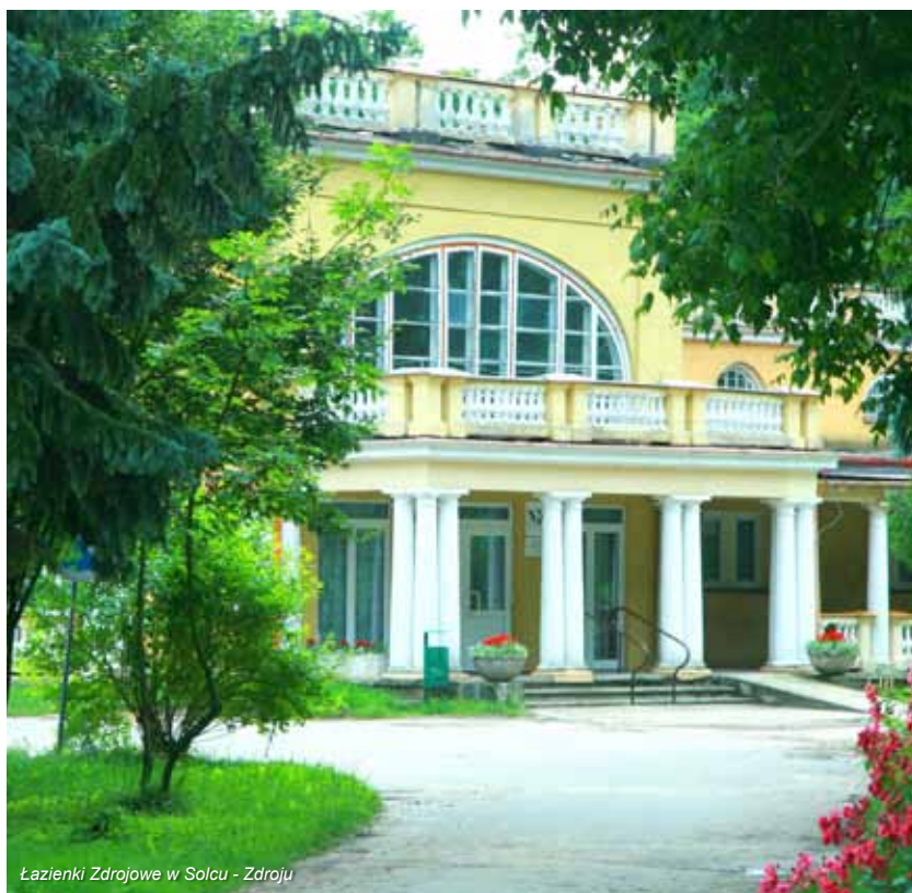
Łazienki Zdrojowe w Solcu - Zdroju