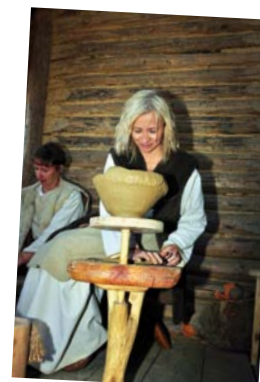
Bieliny, osada średniowieczna.