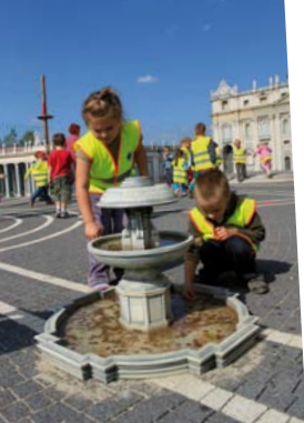
Park Miniatur w Krajnie.