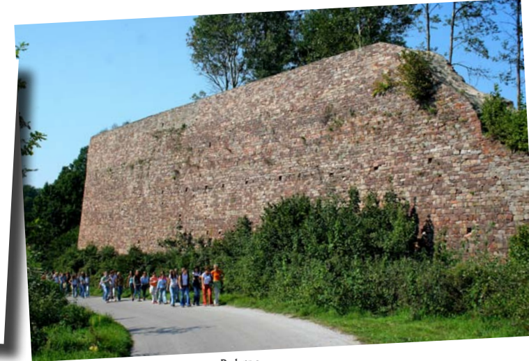
Monumentalny mur oporowy w Bobrzy.

Opisywana miejscowość jest położona u stóp Baraniej Góry, objętej ochroną jako rezerwat przyrody o tej samej nazwie. Będąc w Obłęgorku warto się tam wybrać nie tylko ze względu na piękny las bukowy ale też ze względu na jedne z najpiękniejszych widoków w Górach Świętokrzyskich ze szczytu Baraniej Góry.