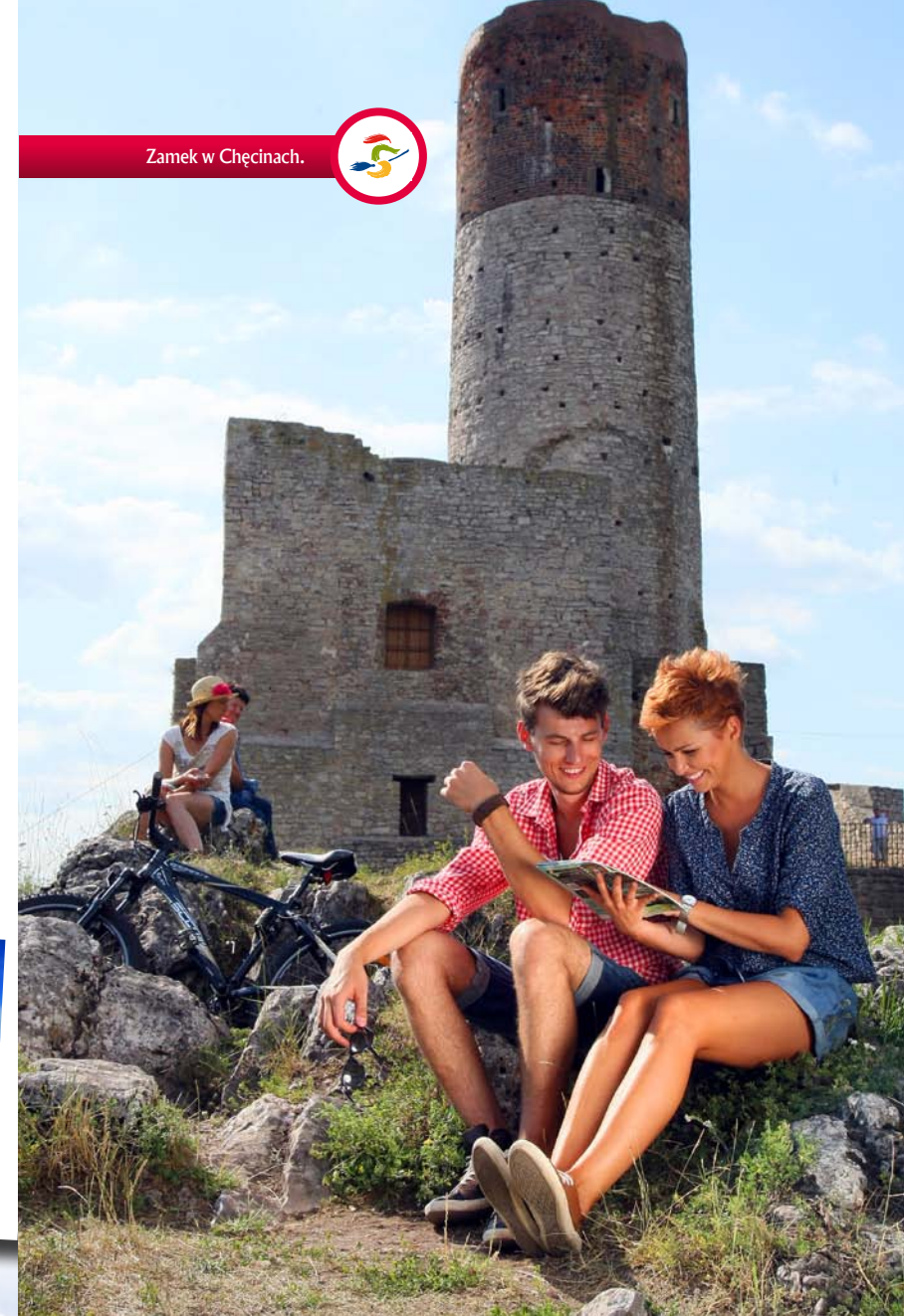
Zamek w Chęcinach.