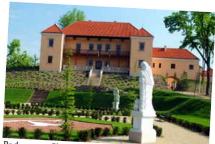
Podzamcze Chęcińskie, widok z ogrodów na pałac.

Urokliwe miasteczko, nad którym wznoszą się ruiny średniowiecznego zamku. Początki Chęcin sięgają czasów Władysława Łokietka. Śmiało można powiedzieć, że miejscowość ma już ponad 700 lat. Na znajdującym się tu zamku królewskim odbywały się m.in. zjazdy z udziałem królów. Był on także więzieniem po wojnie z Krzyżakami zakończonej w 1411 roku oraz służył jako skarbiec. Według